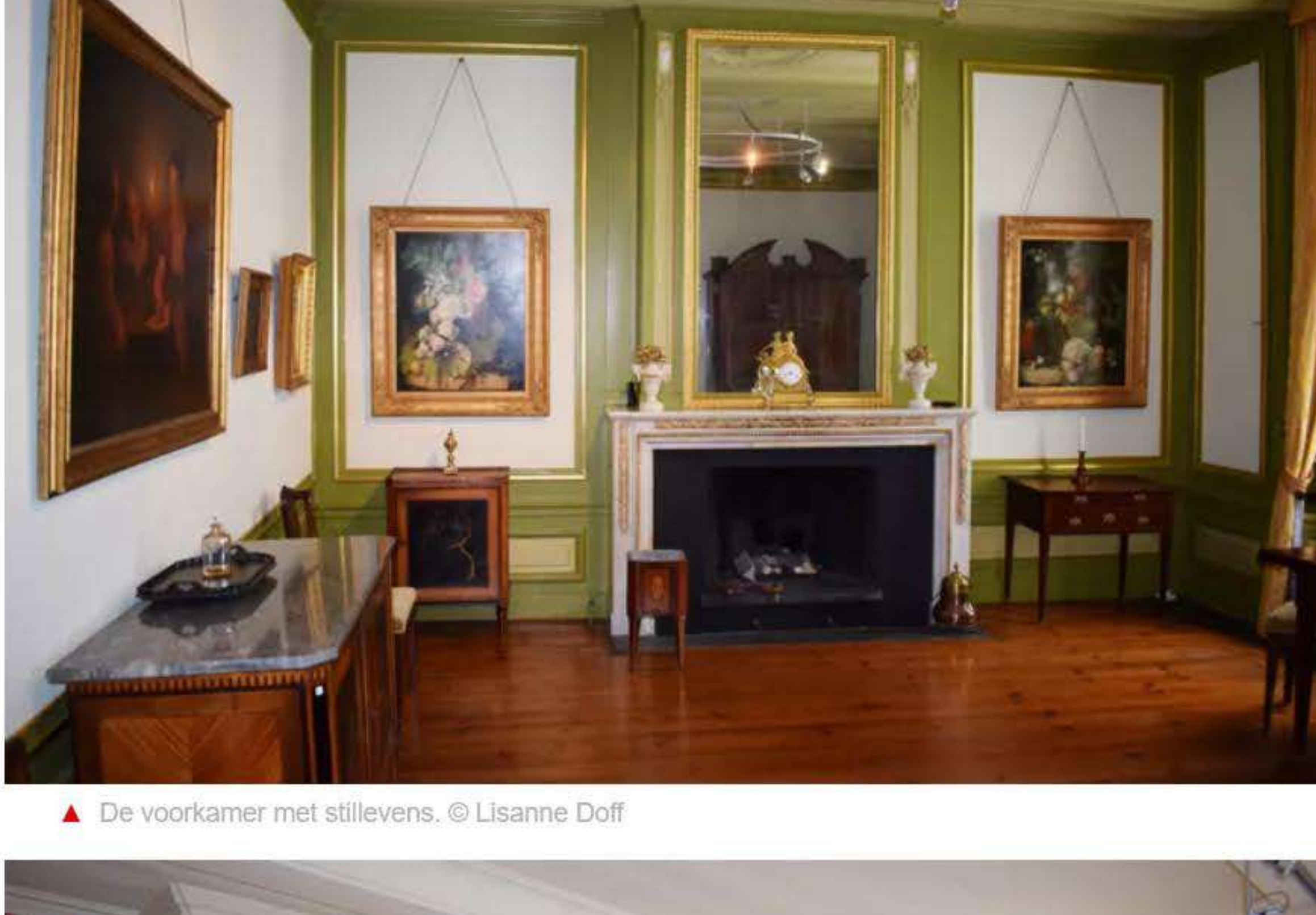
▲ De voorkamer met stillevens.