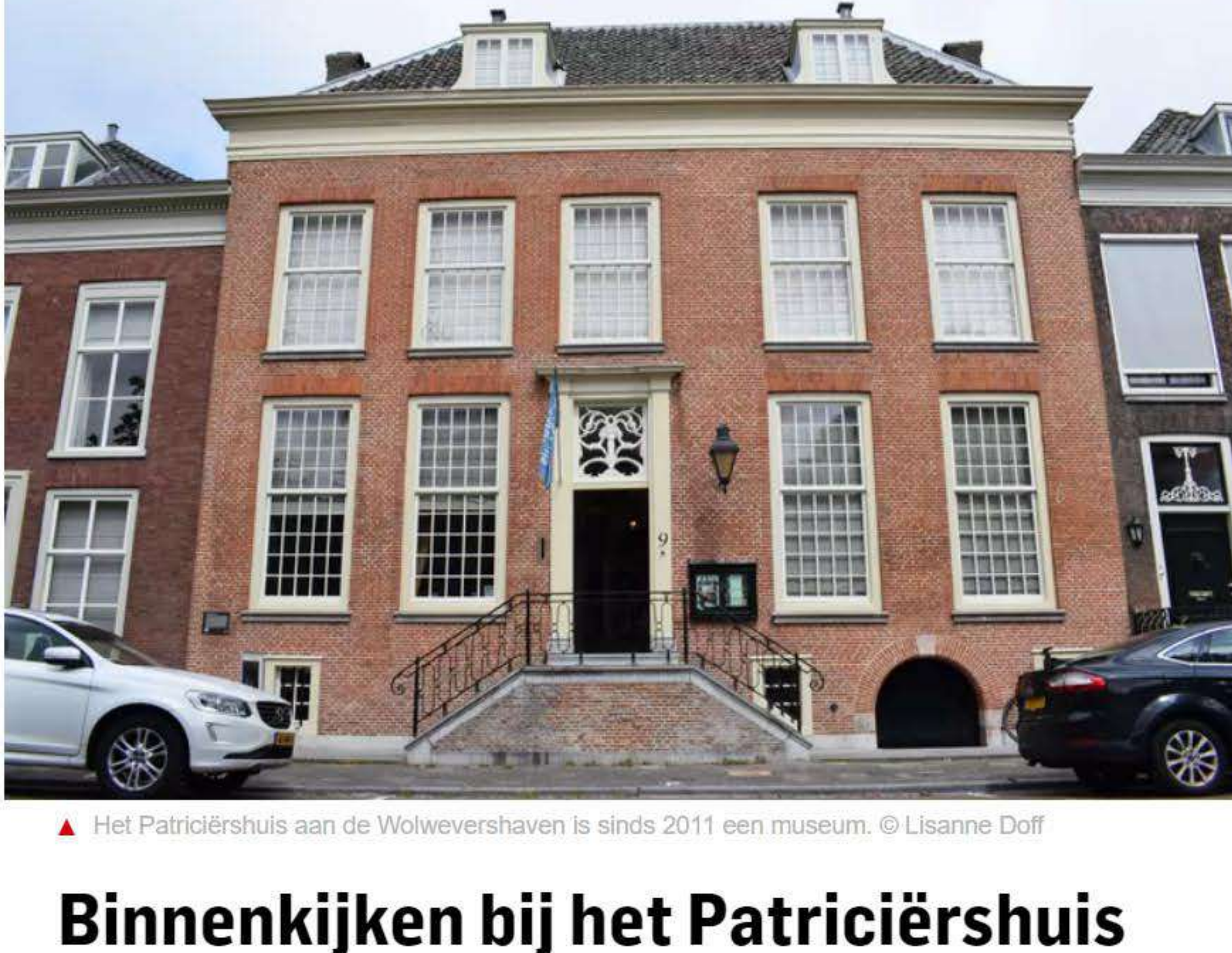
▲ Het Patriciërshuis aan de Wolwevershaven is sinds 2011 een museum.