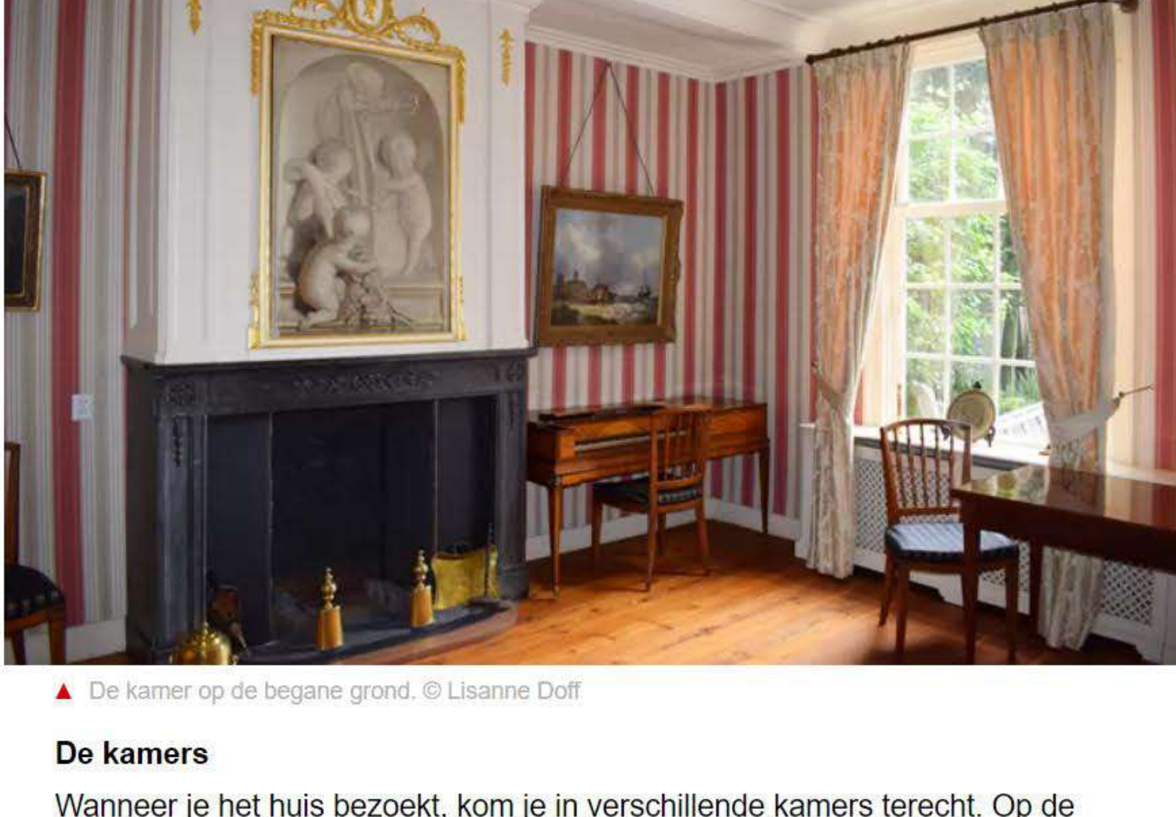
▲ De kamer op de begane grond.