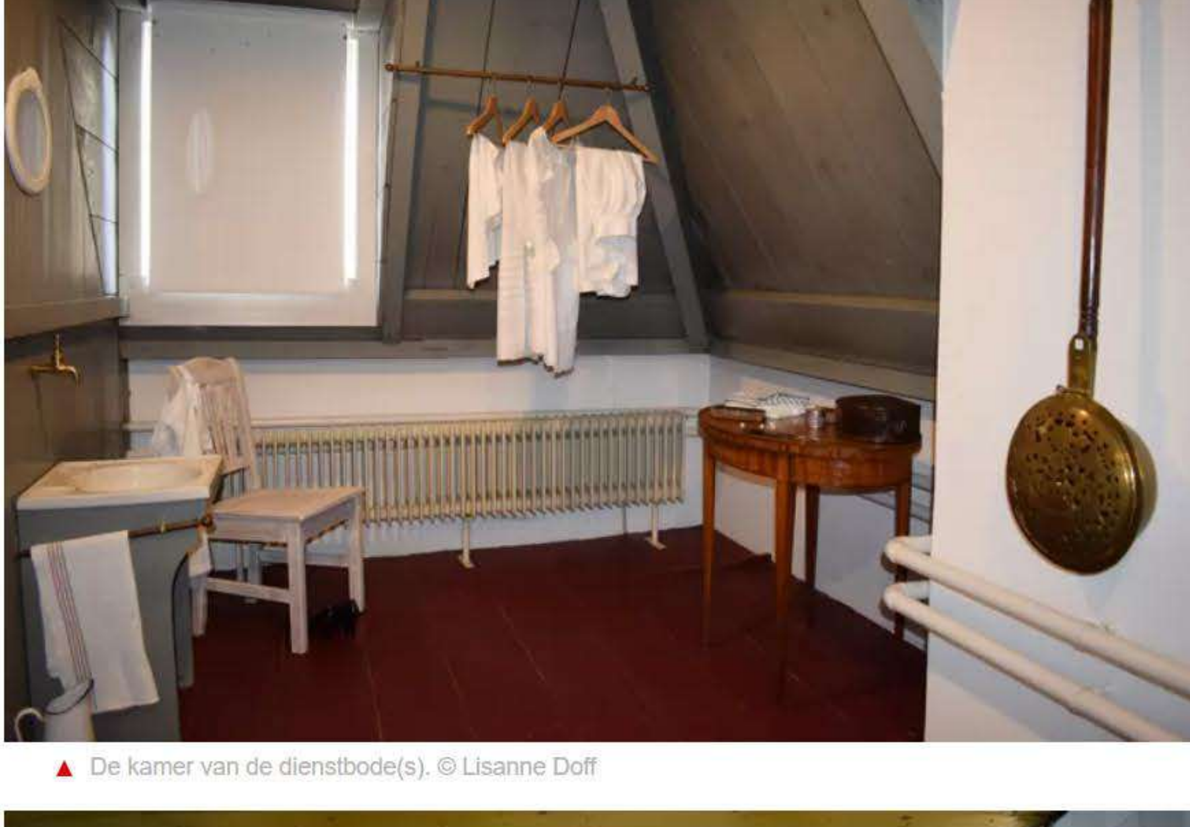
▲ De kamer van de dienstbode(s).