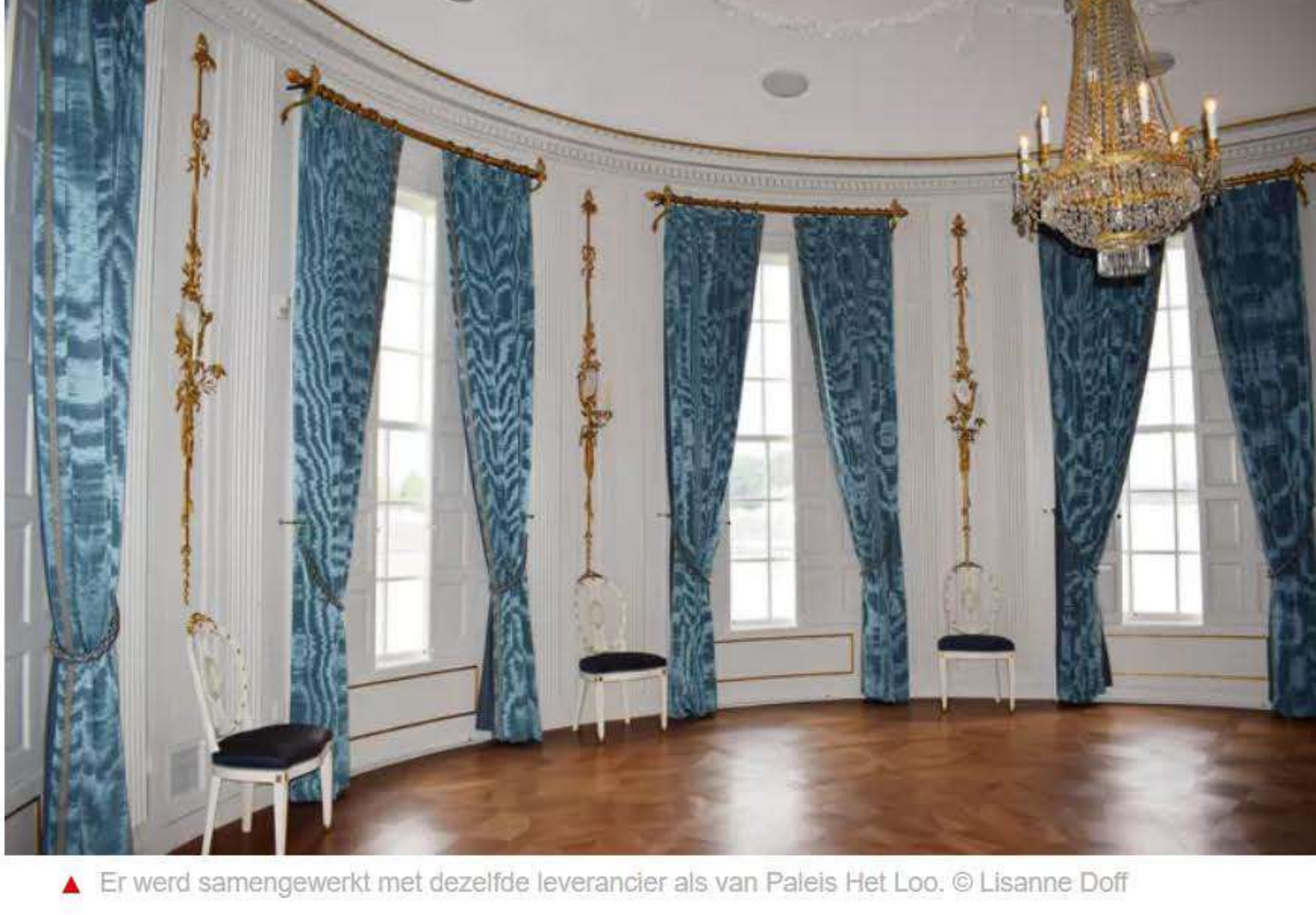
▲ Er werd samengewerkt met dezelfde leverancier als van Paleis Het Loo.