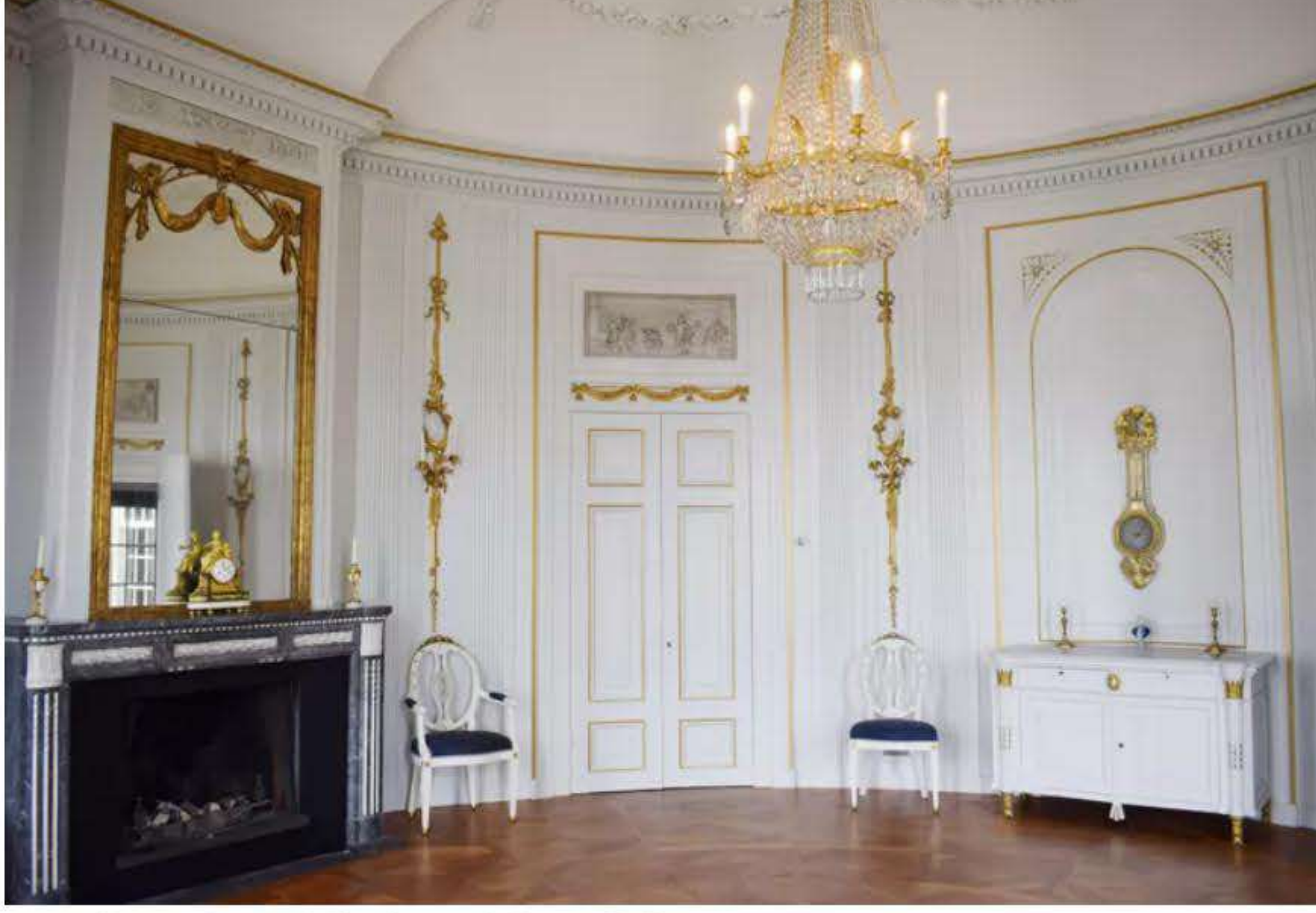
▲ De gerestaureerde Maaskamer.